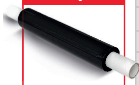
Ręczne - Wydłużona tuleja