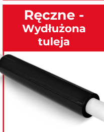
Ręczne - Wydłużona tuleja